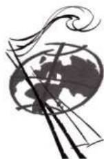
Tableau des récompenses

Association Internationale Des Harpistes A.I.H.A.H